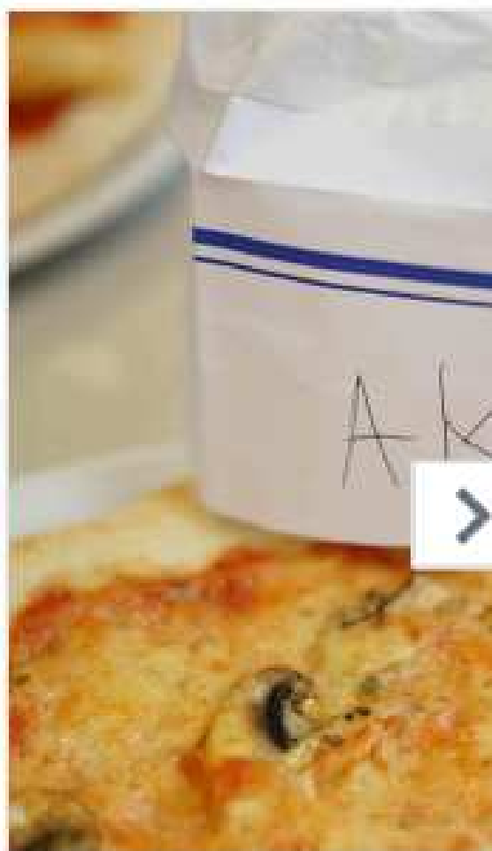
Progetti sociali realizzati - Galdus