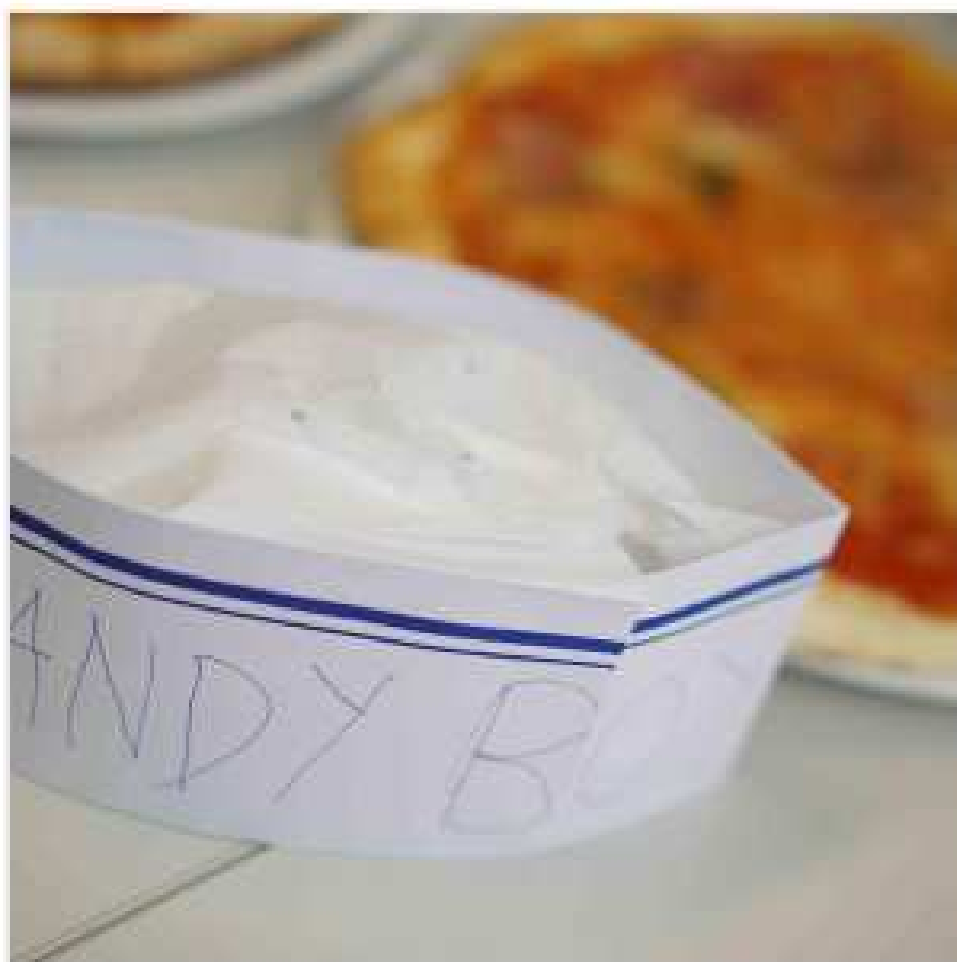
Progetti sociali realizzati - Galdus