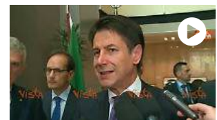
Kashoggi, Conte: "Chiederò spiegazioni a Bin Salman,