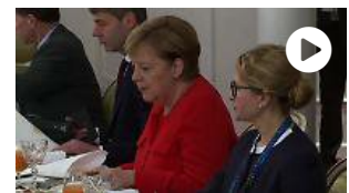
Incontro al G20 fra Merkel e Putin su Siria e crisi con Ucraina

Parigi, 01 dicembre 2018 Guerriglia per le strade di Parigi durante la manifestazione dei gilet gialli contro il caro carburante. Oltre 5500 persone si sono radunate nella zona degli Champs-Élysées dove sono avvenuti scontri con la Polizia. Gli agenti