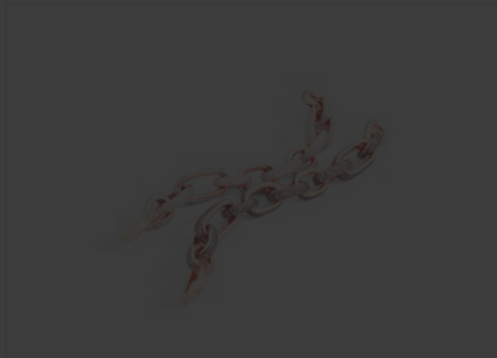
Un modello Pomellato

Festeggiati i suoi primi 50 anni nel 2017, Pomellato prosegue nell'ampliamento della collezione Iconica con l'introduzione di due nuovi anelli bombati, quattro bracciali morbidi e tre rigidi.