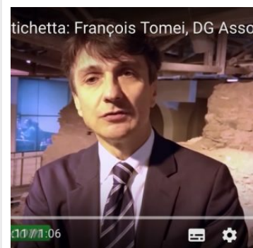
LEZIONI DI ETICHETTA: >> ASSOCARNI E RAI PROMUOVONO LA CARNE BOVINA