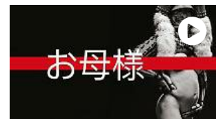
Dai The Pills alle foto, Luca Vecchi: ecco le mie ma... guerriere