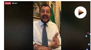
Tav, Salvini: "I partiti del No sono sempre più ridotti"