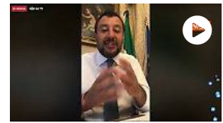
Tav, Salvini: "Se avessero ascoltato la Lega.. meg... che mai"

(Agenzia Vista) Cina, 24 luglio 2019 I nuovi calciatori della Juventus hanno eseguito una prova di canto davanti ai compagni di squadra a Nanchino, in Cina dove è ora il team.