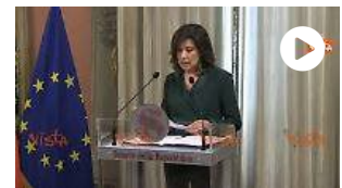
Casellati: "Taglio parlamentari, bene segnali in questa direzione"