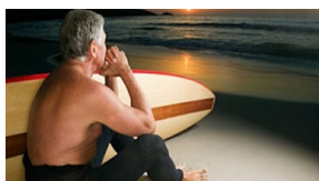
FISHER INVESTMENTS ITALIA