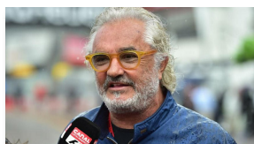
TUTTI IN ITALIA POSSONO F