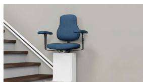
PREZZO DEI MONTASCALE?