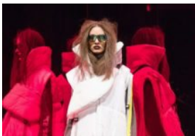
Istituto Marangoni a Taomoda 2019

ARTICOLI CORRELATI ALTRI ARTICOLI DELL'AUTORE