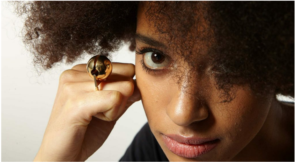
Arnaldo Pomodoro -Jois Didier Ltd