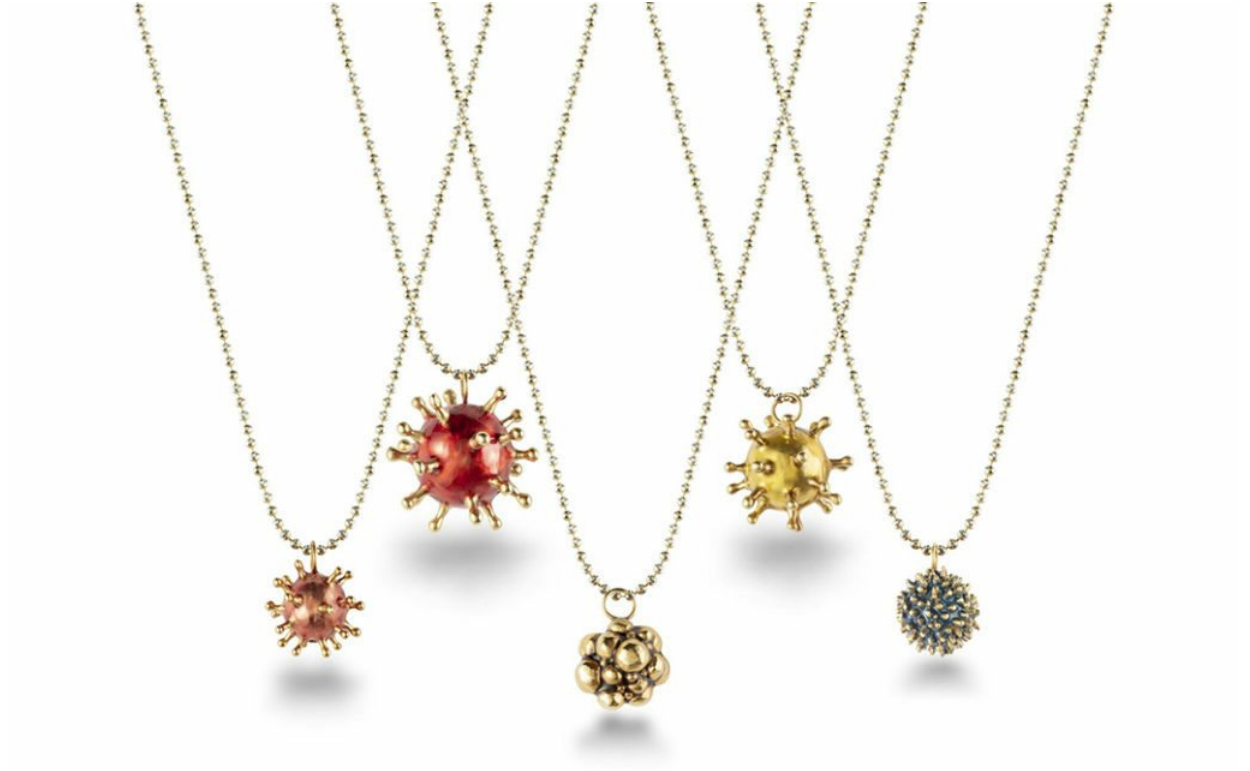
Capsule collection BACTERIUM, Gianni De Benedittis

Tra tutti spicca proprio Gianni De Benedittis che presenterà CARNIVOROUS , la nuova collezione Spring-Summer 2020 di futuroRemoto .