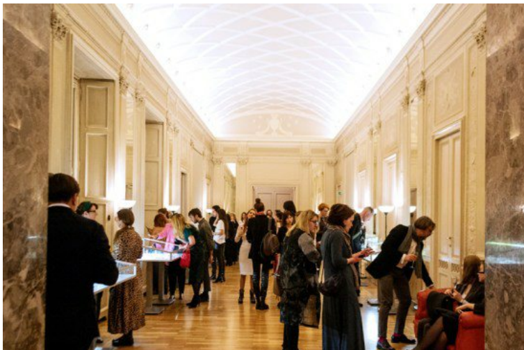
Uno scatto dell'edizione 2018 di Artstar Jewels

Milano si prepara ad accogliere un nuovo evento interamente dedicato al mondo del gioiello: dal 24 al 27 ottobre la città accoglie la Milano Jewelry Week. Ecco tutto quello che c'è da sapere.