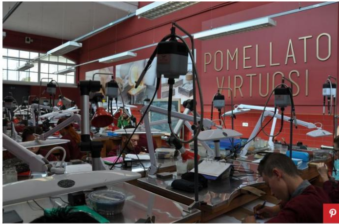
I banchetti orafi di Pomellato Virtuosi in cui gli studenti si cimentano con la preziosa arte della gioielleria.