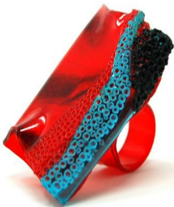
Magma Lab Anello Frontiera